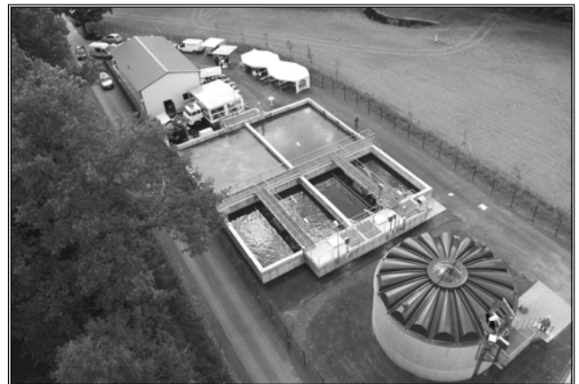
Einweihung der neuen Kläranlage am 27.05.2011