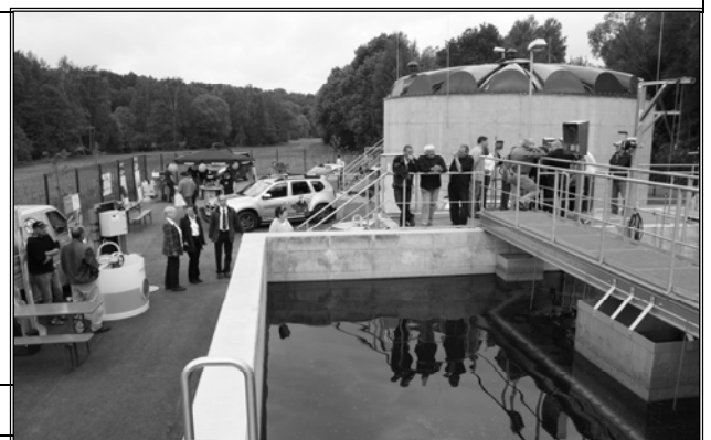
„Tag der offenen Tür“ am 28.05.2011