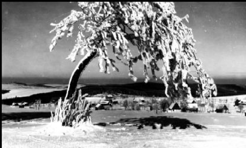
Wind und Wetter Hermsdorf - ein Heimatkalender für 2019