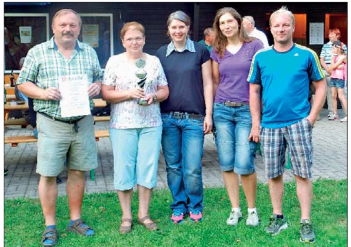
Sieger Pokal der Vereine - FFW Frauenstein

Wie schon erwähnt, funktioniert so ein Preisvogelschießen nur mit der großen Unterstützung der Händler und Gewerbetreibenden, die auch dieses Jahr wieder Preise im Gesamtwert von ca. 1400,- Euro bereitgestellt haben. Dafür nochmals vielen Dank. Bedanken möchten wir uns auch beim Bauhof Frauenstein für die tatkräftige Unterstützung.