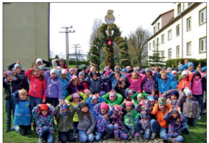
Die Kinder und Erzieherinnen vom Schulhort Frauenstein