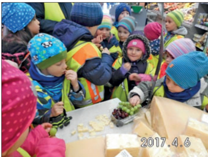
Die „Postmäuse“ und ihre Erzieherinnen

Wir bedanken uns ganz herzlich bei Herrn Fiedler für dieses außergewöhnliche Erlebnis. Demnächst steht ein weiteres schönes Ereignis mit EDEKA an. Da werden wieder Gemüsepflanzen und Kräutersamen in unseren Hochbeeten in der Kita in die Erde gebracht – ebenfalls eine Aktion von EDEKA. Danke im Voraus.