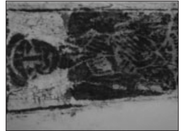
Abb. Gocha Gulelauri

Eröffnung am Sonnabend, dem 20. Mai 2017, um 16.30 Uhr